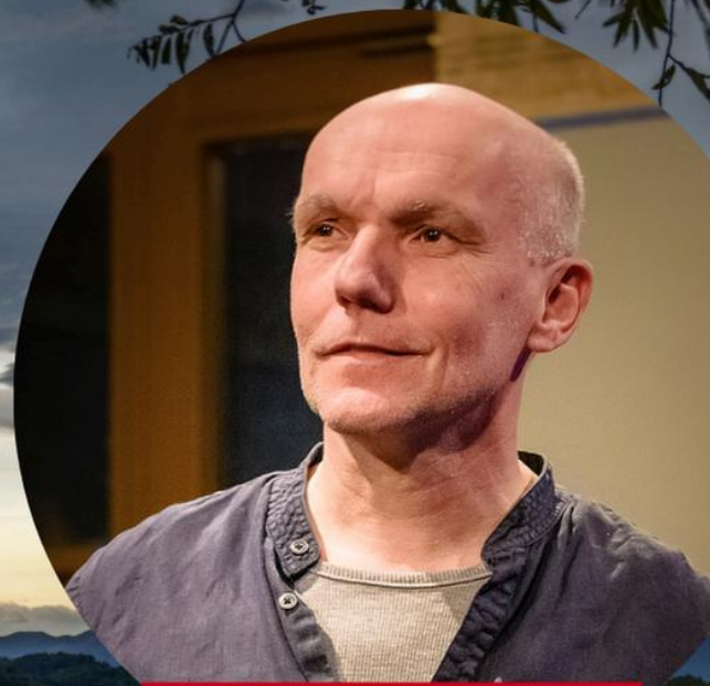
Christian Wirmer Theater Schauspieler